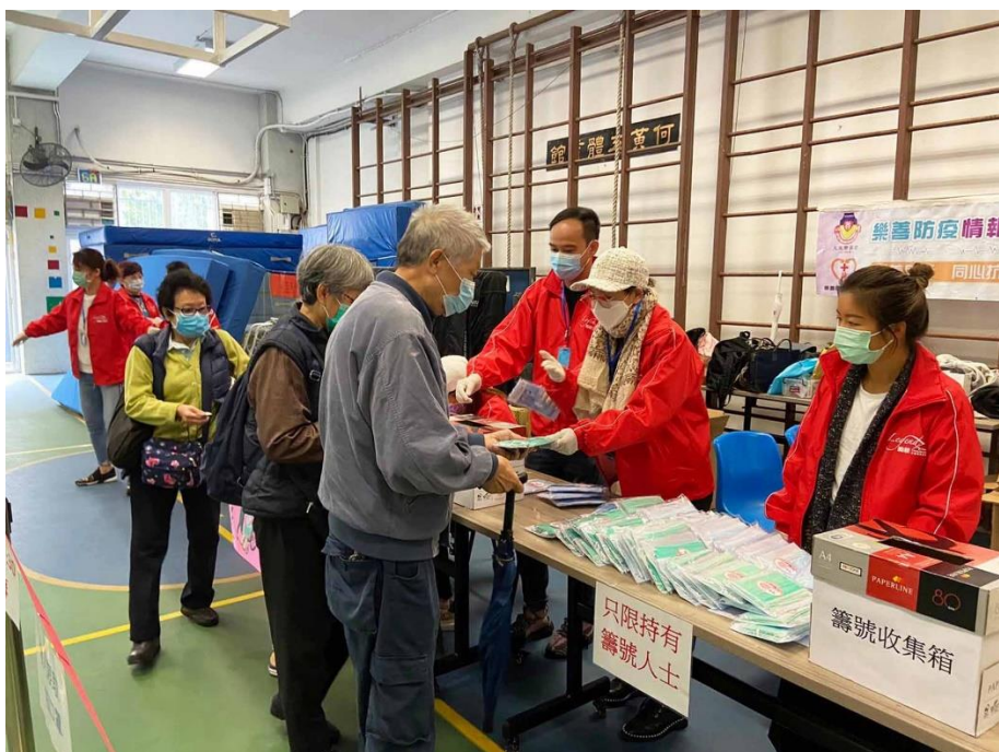
樂善堂將收到的防疫物資派發予有需要人士