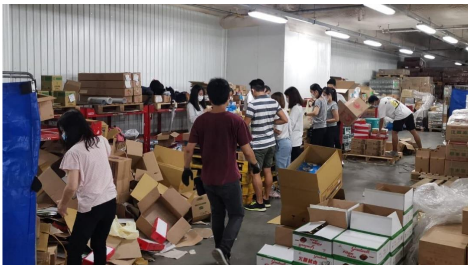
善堂一班熱心的義工協助包裝食物包

樂善堂亦應社會福利署委託，透過外展醫生到訪院舍，就院舍感染控制的實況，提供專業的改善建議，並教授院舍員工有關防疫知識和技巧。