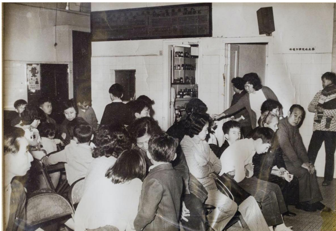
當年樂善堂醫療所候診場面

因應時代及環境的轉變，樂善堂服務亦日漸多元化。現時轄屬機構已逾五十個，分佈遍及港九新界。