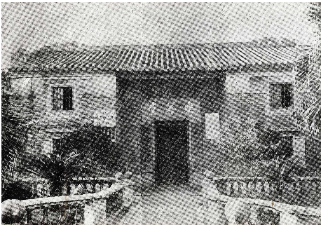
九龍樂善堂原址建於 1880 年