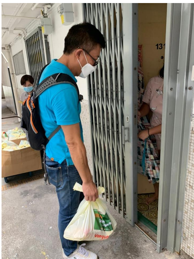
樂善堂義工上門為黃大仙區長者派發食物包