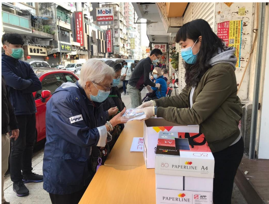
樂善堂於年初成立「樂善堂口罩銀行」，籌募防疫物資並分發予有需要人士。

時至今日，樂善堂仍然秉承「救災紓困、贈醫施藥」的宗旨。本港於 2020 年初，面對新型冠狀病毒疫情的衝擊，基層市民的防疫物資嚴重不足。有見及此，樂善堂迅速成立「樂善堂口罩銀行」，與各界團體及企業合作，籌募防疫物資並分發予有需要人士。截至 8 月，已派發超過 60 萬個口罩、防疫物資及日用品，受惠弱勢社群逾 2 萬 8 千戶。其轄屬診所亦增設「新型冠狀病毒深喉唾液化驗」服務，及參與衛生防護中心的「加強化驗室監測計劃」，協助進行社區檢測。