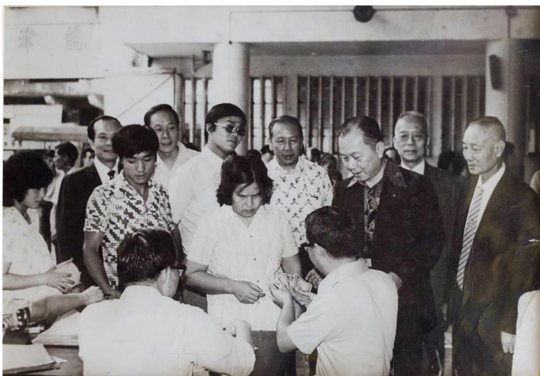
樂善堂當年派發救濟金的場面

樂善堂的服務與時並進，眼見當時絕大部分女子不能上學，於 1929 年，在九龍城區開辦首間女子義學，打破當時「女子無才便是德」之傳統。在六十年代，又開辦留產所，減少婦女生產時遇到意外。之後又與香港戒毒會合作，於樂善堂閣樓設立戒毒登記處，當年九龍城寨很多癮君子，都會到樂善堂求助。樂善堂又陸續開設學校、診所及安老院舍，以服務各階層市民。